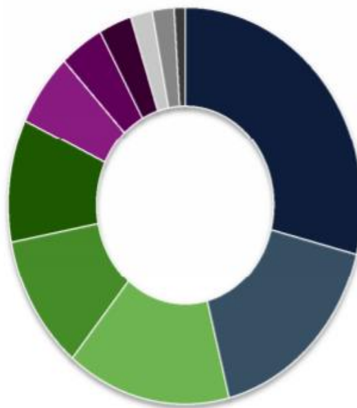
Meldingen per sector